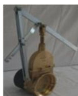
Valve for the pumping / Vanne de type tonne à lisier