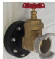
Bloc bride avec vanne tour / Valve with gate