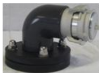
Overflow safety vent / Trop plein