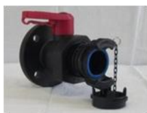
Vanne PPG Ø 50 (équivalent de l'inox) verrouillable / PPG Ø 2" valve (stainless steel equivalent) lockable