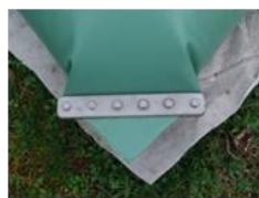
Intensification of angles with stainless steel plaques and bolts / Renforcement des coins avec plaquettes et boulonnerie INOX